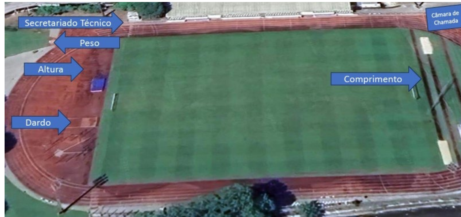
ESTÁDIO MUNICIPAL DE POMBAL