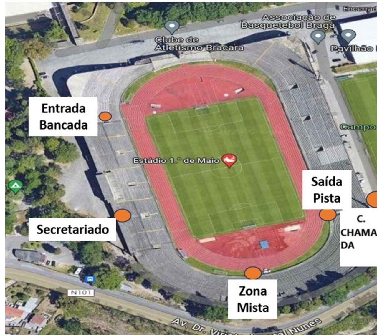
ESTÁDIO 1.º DE MAIO