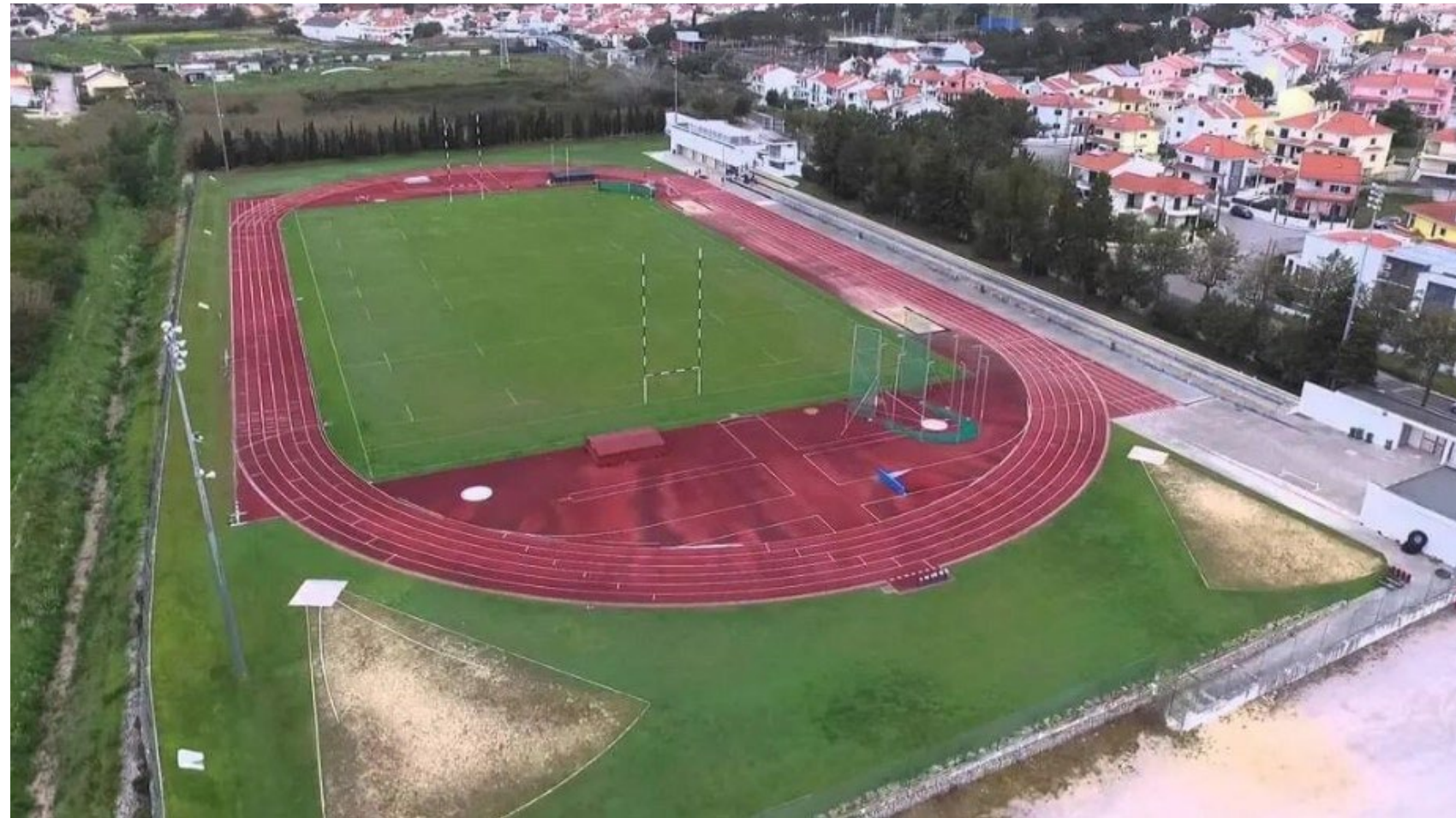
PISTA MUNICIPAL DE ATLETISMO ALBERTO CHAIÇA ALMADA - Sobreda