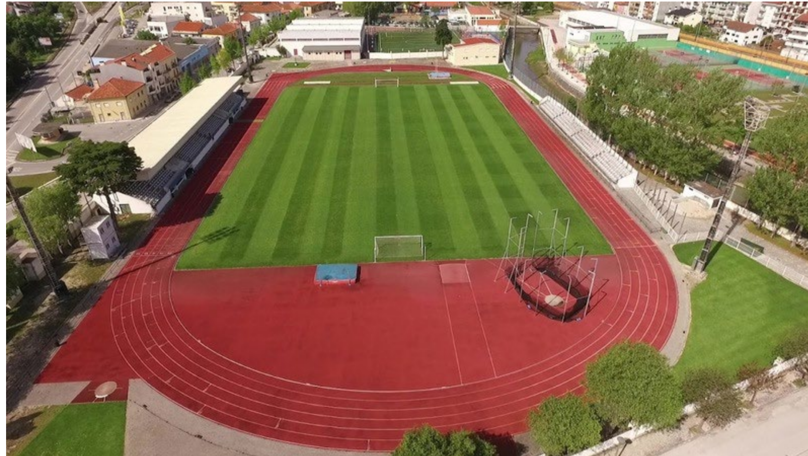
ESTÁDIO MUNICIPAL DE POMBAL