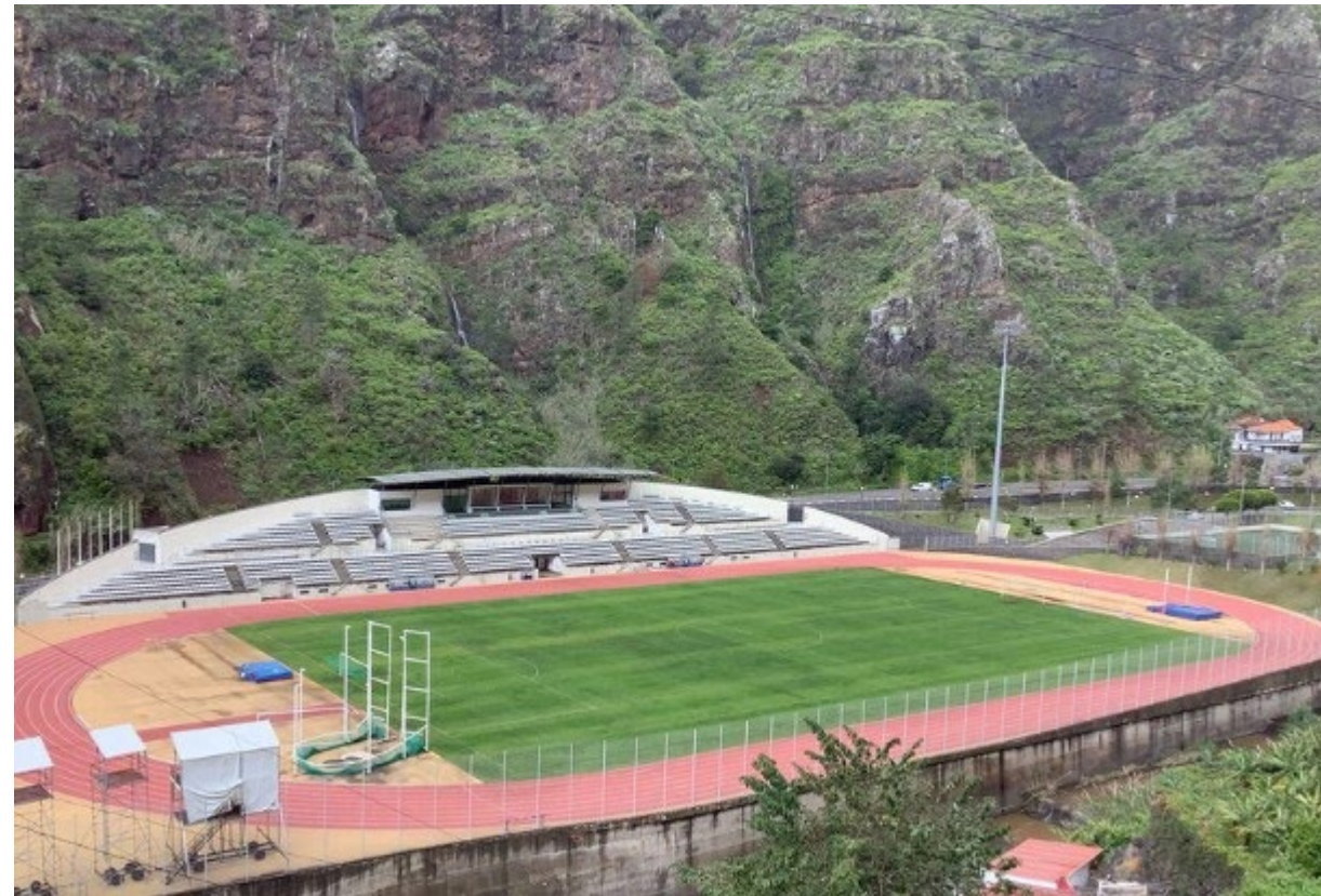
COMPLEXO DESPORTIVO DA RIBEIRA BRAVA Madeira