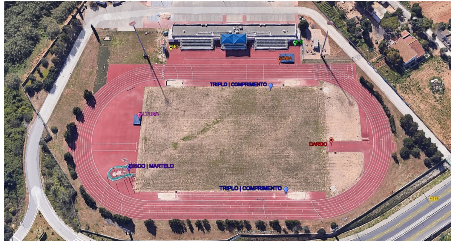
PISTA DE ATLETISMO DE FARO