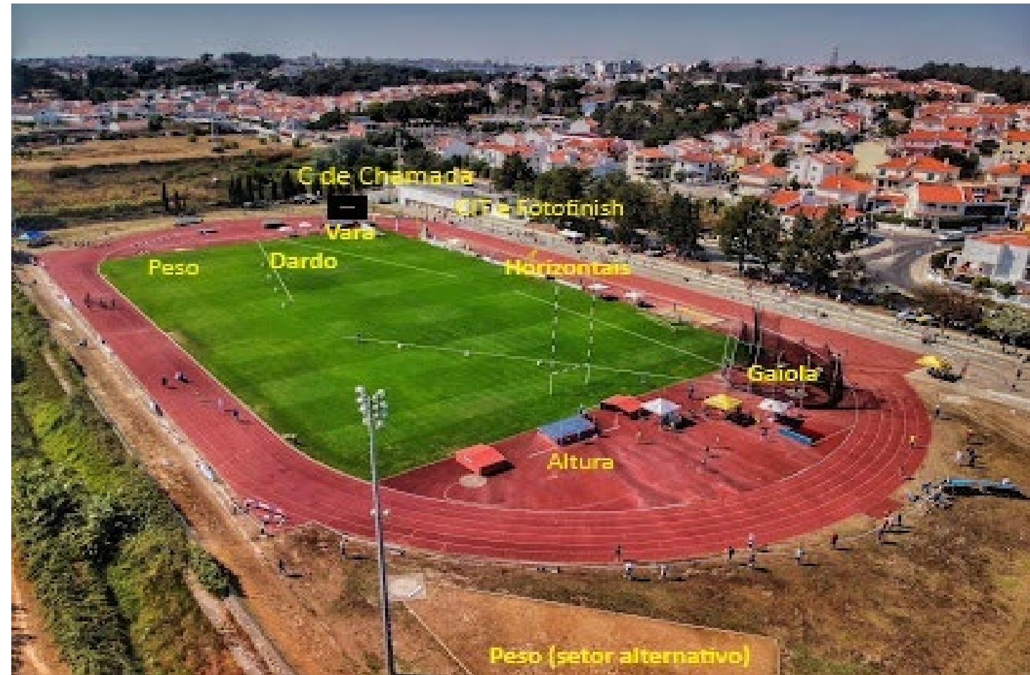
PISTA MUNICIPAL DE ATLETISMO ALBERTO CHAIÇA ALMADA - Sobreda