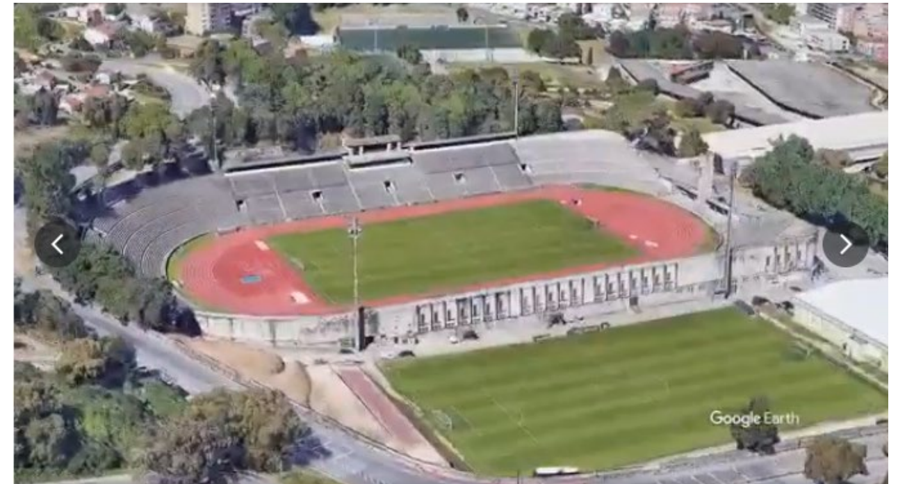
ESTÁDIO 1.º DE MAIO