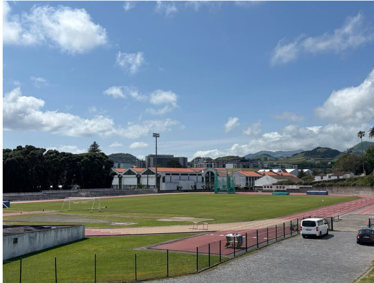
COMPLEXO DESPORTIVO DAS LARANJEIRAS Ponta Delgada - Açores