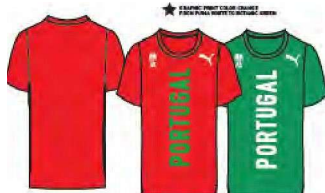
518470 _ TRAIN SS TEE C88D-18YHRE KNIT, PESJL