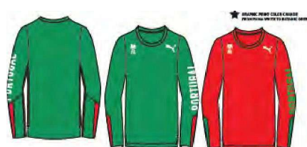
51Q1, 71 TRAIN LS TEE Oel.Umoxi'RCIOCK, PESJ.D