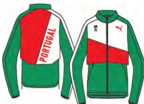
519545 THE WARM-UP JACKET STRETCH WOVEN, PES/EL