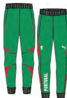
518467 _ VW SWEAT PANTS FRENCH TEMI' PESICQUEL