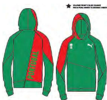
518477 _ TRAIN W_JJP SWEAT TOP DOUBLE P'ALIE KJL.PE:5:EL