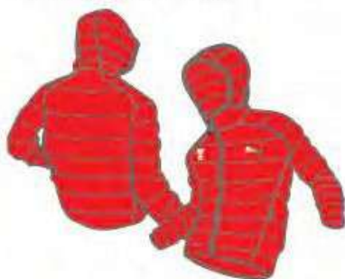
519194 _ PWRWarm PACK LITE 600 DOWN JACKET QUILTED DOWN JACKET, REF. INLINE 580033