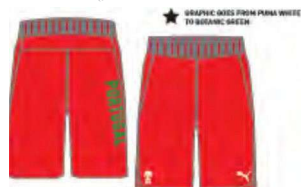
518468 _ VW SWEAT SHORT 110"1 FHNOI1ED'(. PBICOU