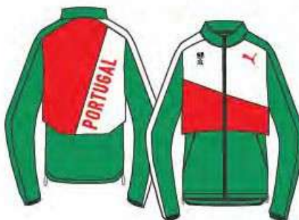
519545 _ THE WARM-UP JACKET STRETCH WOVEN, PES/EL.