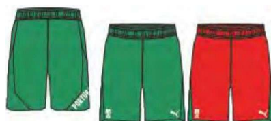
518474 _ TRAIN SHORT II O'I IsoluME SHAPE TUTIMEJ IUH1' PD'