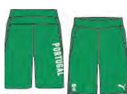
518465 _ VW CASUAL SHORTS (10"1 T8ET14WOYEJIL1'18JIL