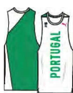
518'72 _ TRAIN SL T8E 816w'18YHREJLJot,PESJ'EL_