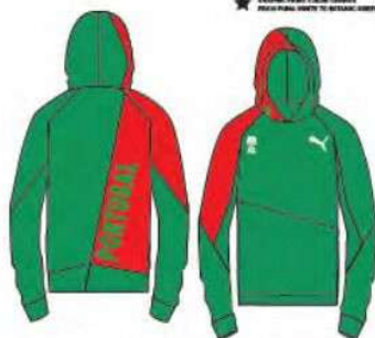
518477 _ TRAIN W-UP SWEAT TOP DOUBLE PIQUE KNIT, PES/EL.