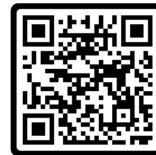
Confirmações e Resultados