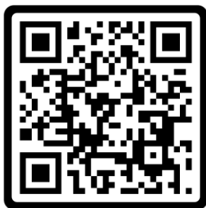
Listagem de Sapatilhas WA