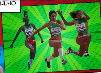
VOANDO SOBRE AREIA