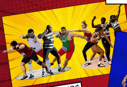
GUERRA DOS SEXOS

DE 23 DE JUNHO A 8 DE JULHO DUÉLOS NAS PISTAS DE PORTUGAL